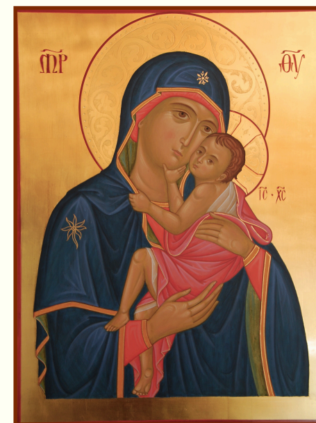
VERGINE DEL CARMELO