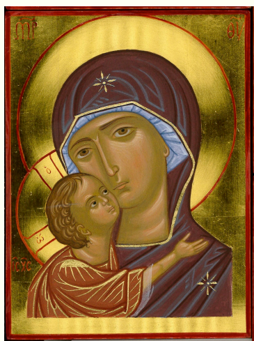
MADRE DI DIO DELLA TENEREZZA