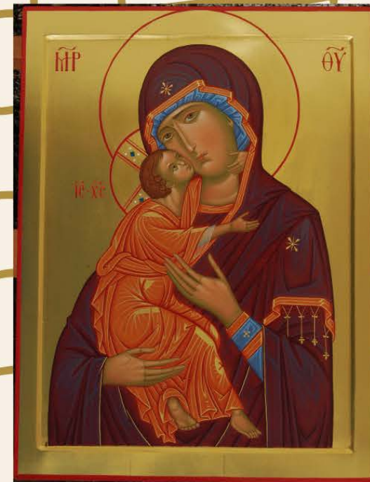
MADRE DI DIO DELLA TENEREZZA

Il corso propone l'esperienza della pittura completa di una icona, attraverso tutte le sue tappe, evidenziandone la tecnica, l'estetica e la teologia in essa racchiuse.