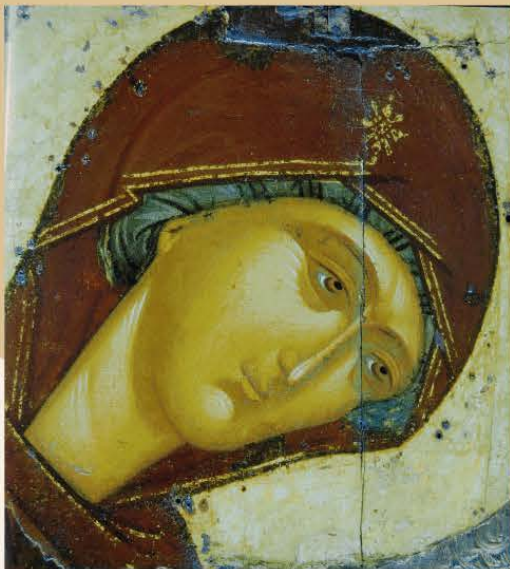
MADRE DI DIO DELL'INTERCESSIONE