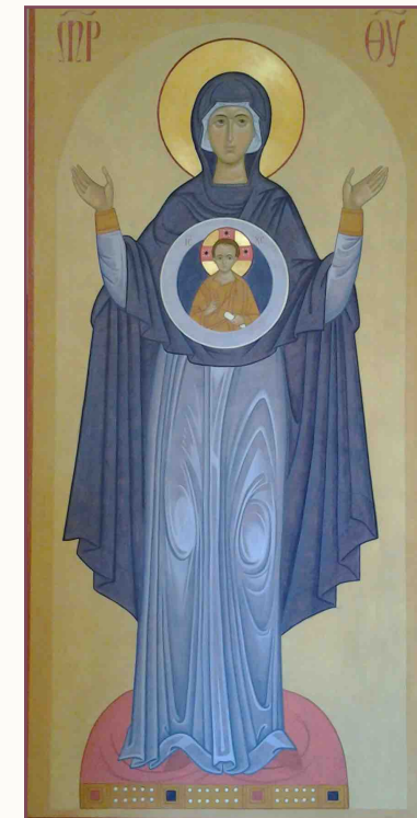
Madre di Dio del segno

Si consiglia di munirsi di grembiule, riga, squadra, compasso, forbici, matita a mine dure.