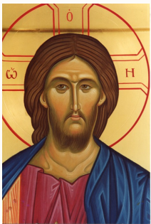
Volto di Cristo

Il corso propone l'esperienza della pittura completa di una icona, attraverso tutte le sue tappe, evidenziandone la tecnica, l'estetica e la teologia in essa racchiuse. Non pretende da subito di formare degli iconografi (per questo si richiedono anni di apprendistato), vuol fornire delle concrete chiavi di accesso, all'arte sacra in vista di trarne benefici a diversi livelli: