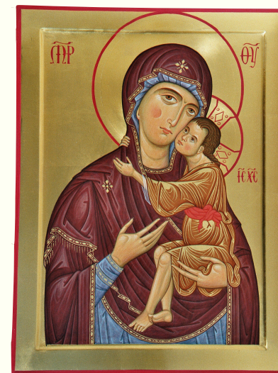
VERGINE DI AVERSA