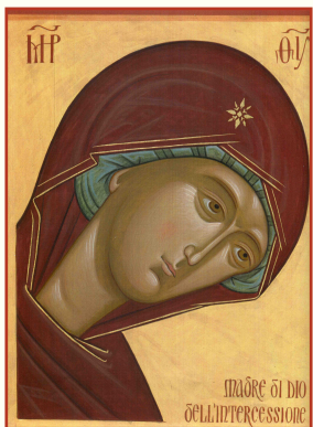
MADRE DI DIO DELL'INTERCESSIONE