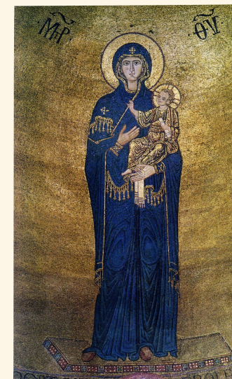
Madre di Dio di Torcello

Maestro Giovanni Mezzalira Assistente Paola Gandini