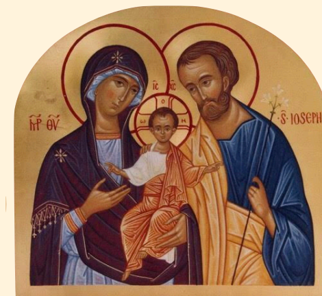
LA SACRA FAMIGLIA

23 - 24 MARZO 6 - 7 / 13 - 14 APRILE 2024