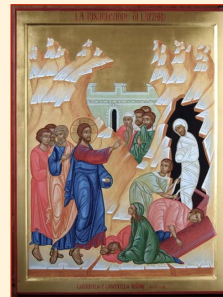
LA RESURREZIONE DI LAZZARO

MISURA TAVOLA CM. 35x45 (INT. 29,5 x 38,5)