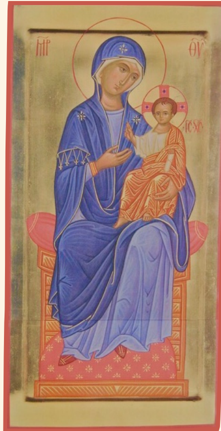
Madre di Dio in trono

Il corso è una piccola esperienza che può avere risonanza e illuminare ambiti più vasti come l'intera nostra vita, la preghiera, la liturgia, i rapporti interpersonali..