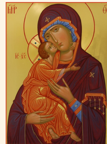
Madre di Dio di Vladimir