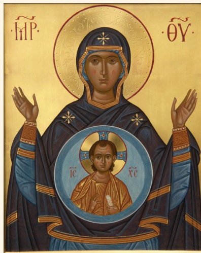
Madre di Dio del Segno

La pratica di quest'arte è pertanto espressione di una nuova unità che le Chiese stanno ricostruendo in Cristo.