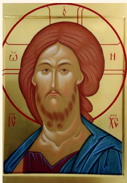
Volto di Cristo

Il corso è una piccola esperienza che può avere risonanza e illuminare ambiti più vasti come l'intera nostra vita, la preghiera, la liturgia, i rapporti interpersonali.