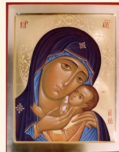
Madre di Dio di Korsun